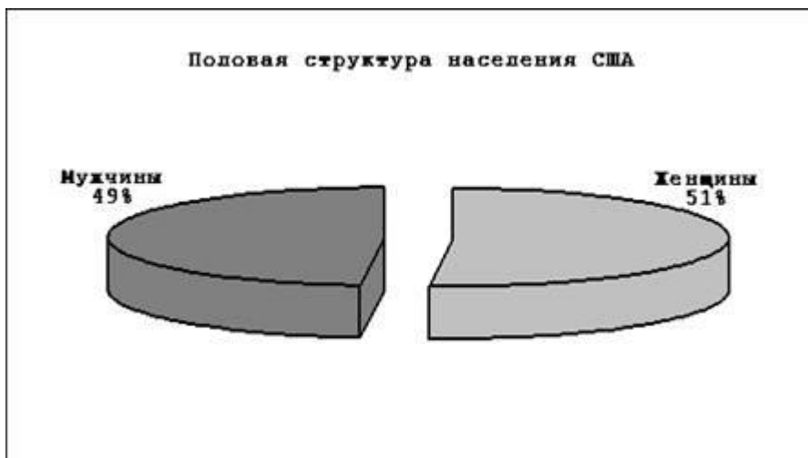
Мужское и женское население (США)