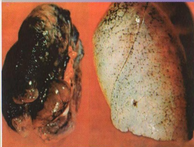
больная ткань легкого здоровая ткань легкого